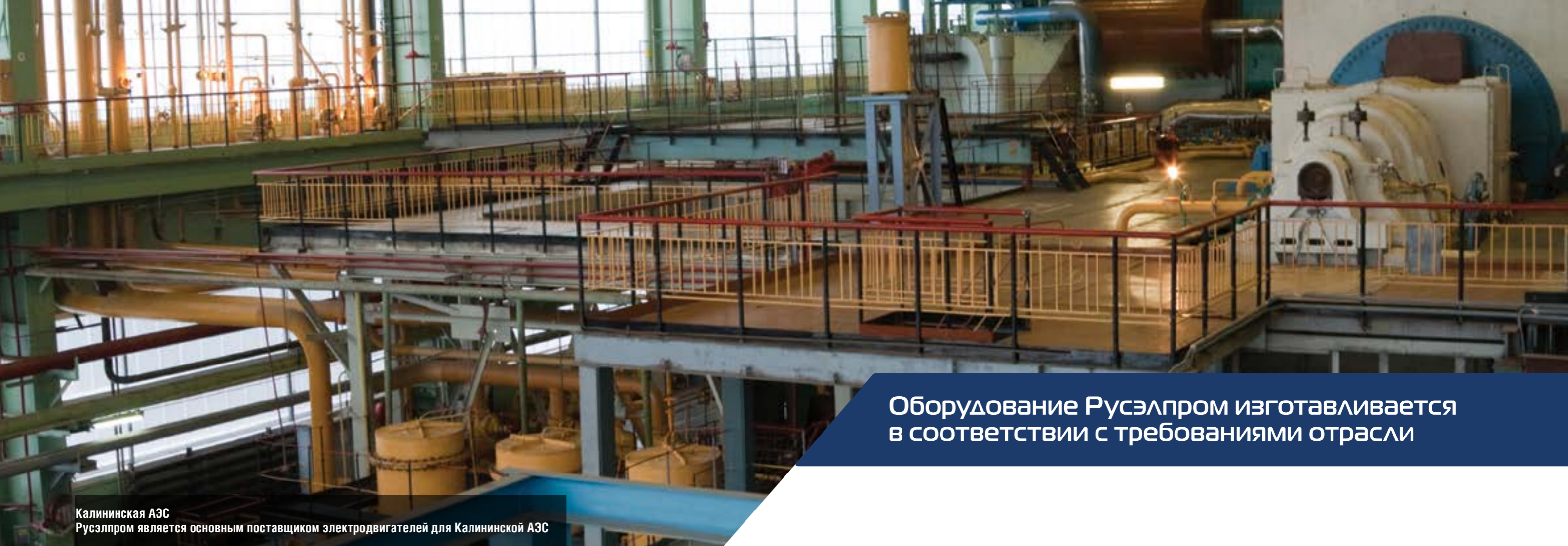
Калининская АЭС Русэлпром является основным поставщиком электродвигателей для Калининской АЭС

Оборудование Русэлпром изготавливается в соответствии с требованиями отрасли